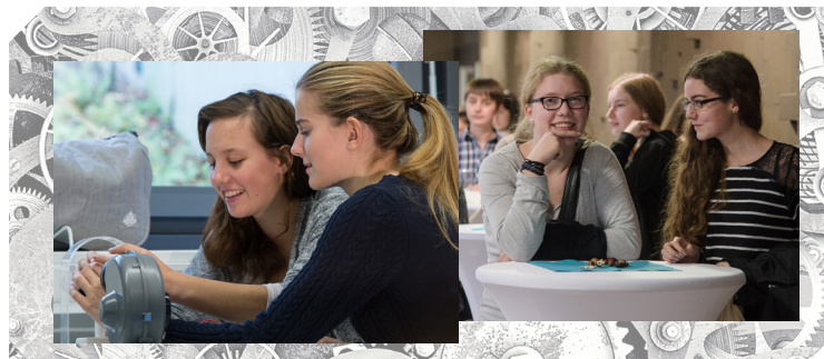
„Mädchen und Technik“-Aktionstag 2015, ME Saar

Im Auftrag des Verbandes der Metall- und Elektroindustrie des Saarlandes (ME Saar) e. V.